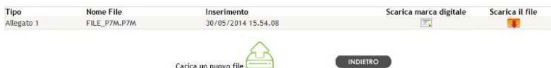
Fig. 4-Lista File

Dalla schermata di figura 4 è possibile scaricare il file precedentemente caricato sul sistema e scaricare l'impronta digitale associata al singolo caricamento (la cosiddetta "ricevuta").