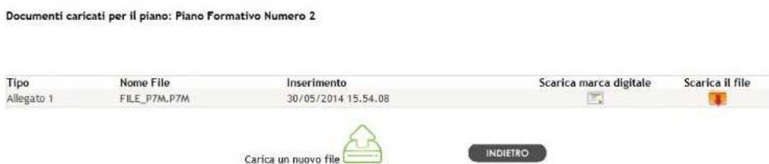
Fig. 4 –Lista File

Al termine del caricamento, se non è stata sollevata eccezione dal sistema, sarà aggiornata la lista dei file caricati, come mostrato in figura 4.