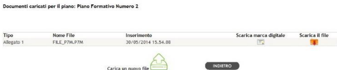
Fig. 4 –Lista File

Al termine del caricamento, se non è stata sollevata eccezione dal sistema, sarà aggiornata la lista dei file caricati, come mostrato in figura 4.